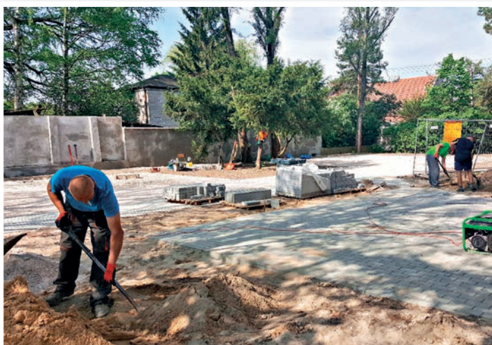
Głos zamieniony w inwestycję. Już niedługo będzie można trenować krzepę na siłowni plenerowej przy Turystycznej, która powstała dzięki Mareckiemu Budżetowi Obywatelskiemu.

– Pomysłów markowianom nie brakowało i mamy nadzieję – nie będzie brakować. Wystarczy wypełnić formularz zgłoszeniowy, w którym znajdują się m.in. opis projektu, szacunkowy kosztorys (zweryfikujący go urzędnicy) i lokalizacja. Niezbędne jest też uzyskanie 25 podpisów z poparciem. W porównaniu z ubiegłym rokiem różnica jest taka, że