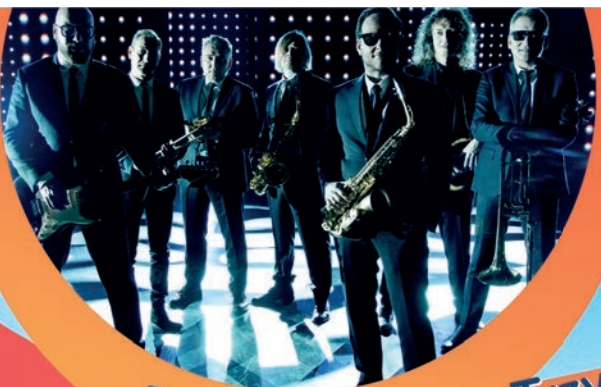
Poparzeni Kawą Trzy