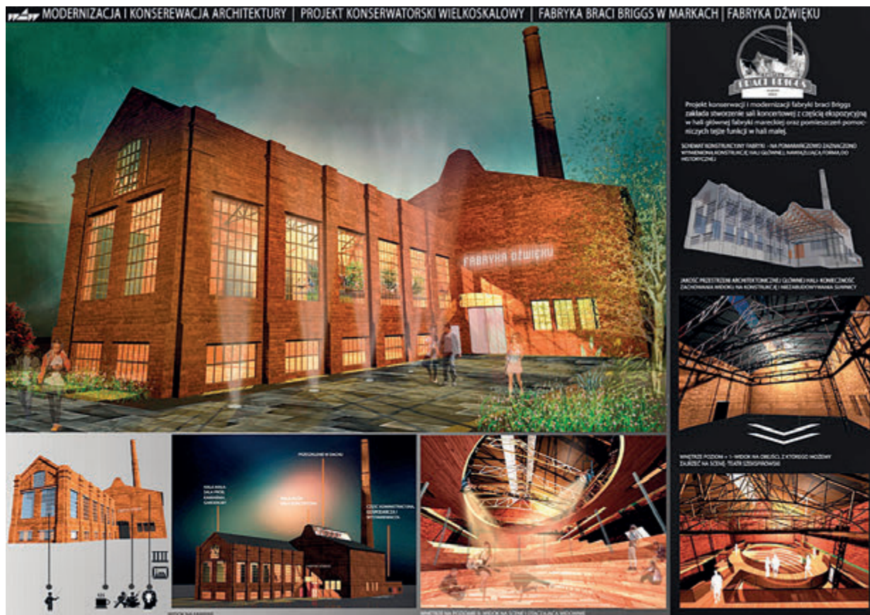
"Rewitalizacja zespołu przemysłowego Fabryki Braci Briggsów w Markach, Fabryka dźwięku" - autor: Karolina Kowalczyk.

Miasto Marki jest w fazie przygotowywania projektów dotyczących rewitalizacji obiektów zabytkowych na terenie gminy.