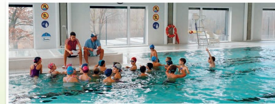
Wizyta na basenie MCER jest stałym punktem mareckiego Lata w mieście.

1. Tradycyjnie wakacyjne zajęcia dla dzieci organizują nasze szkoły. W tym roku odbędą się one w trzech placówkach: