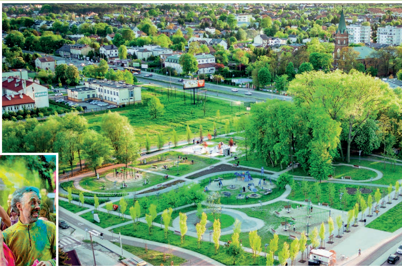
Park Wolontariuszy stał się miejscem spotkań naszych mieszkańców. To tu odbywała się miejska potańcówka (fot. po lewej), to tu odbędzie się święto holi (środkowa fot.)