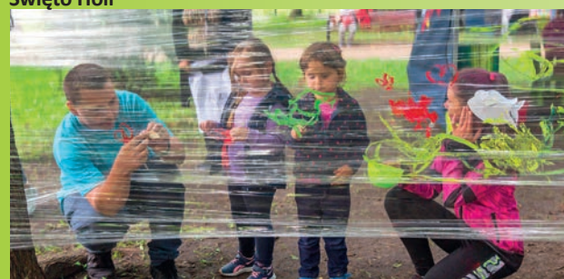
Warsztaty w parkach