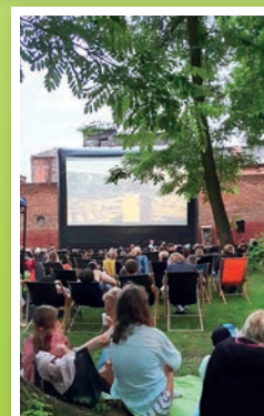
Lato, czwartek wieczór, dobry film, kubek herbaty – nie w domu, ale ze znajomymi w pięknym parku!