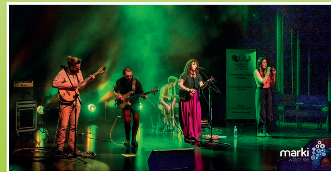
„Sumana” wystąpiła już na scenie MCER, w sierpniu pojawi się również w Parku Briggsów.

Oprócz tego – jak zwykle – wiele atrakcji w parku. Ani mali, ani duzi nie będą się nudzić. Zapraszamy w ostatnią niedzielę sierpnia!